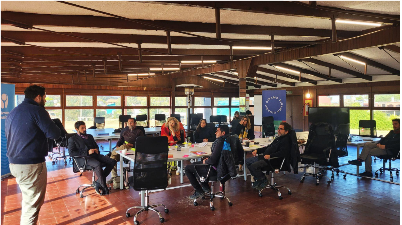
DINAMO SECTORIAL LETRAS 4/6